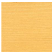
410 Бесцветное шелковисто- матовое